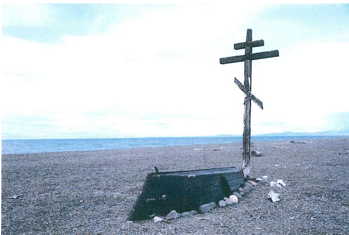
2. Могила В. И. Павлова