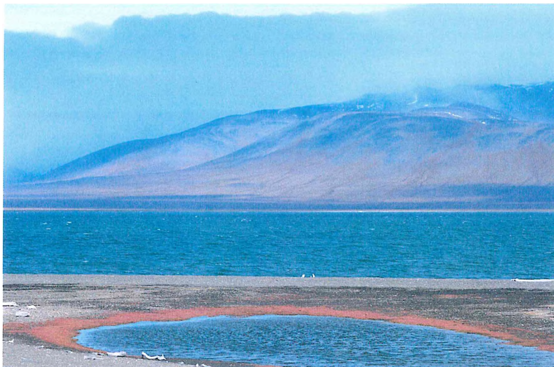
1. Вид с косы Сомнительная на побережье острова