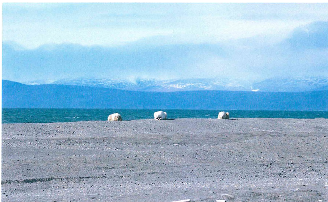
4. Полярные медведи отдыхают на косе Сомнительная