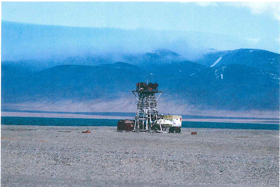
6. Навигационная башня и балок заповедника Автор: Придорожная Татьяна