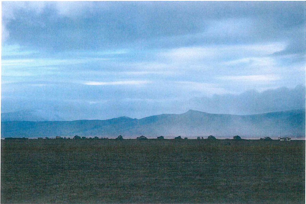
5. Бывший поселок Звездный Автор: Придорожная Татьяна